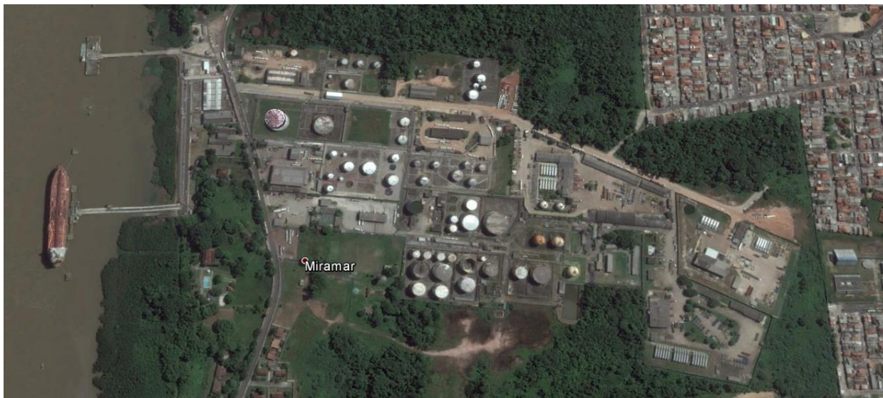
Figura 1: Localização do Terminal Petroquímico de Miramar

O Terminal Petroquímico de Miramar está localizado na margem direita da baía de Guajará, formada pelo encontro da foz dos rios Acará e Guamá, a uma distância de 5km do Porto de Belém, circunscrito a áreas urbanas do município. A figura a seguir apresenta imagem aérea do Terminal Petroquímico de Miramar.