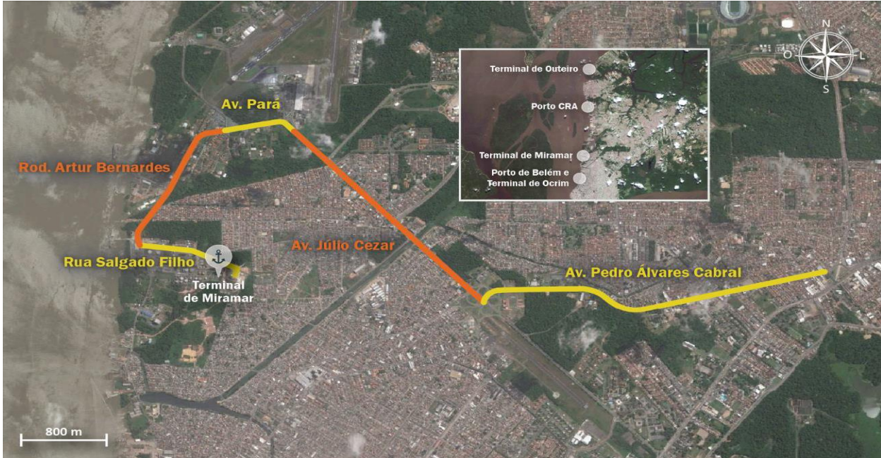
Figura 5: Vias de entorno ao Terminal Petroquímico de Miramar

O entorno do Terminal Petroquímico de Miramar é caracterizado pela existência de áreas urbanas, e seu acesso é feito, principalmente, pelas vias destacadas na figura a seguir.