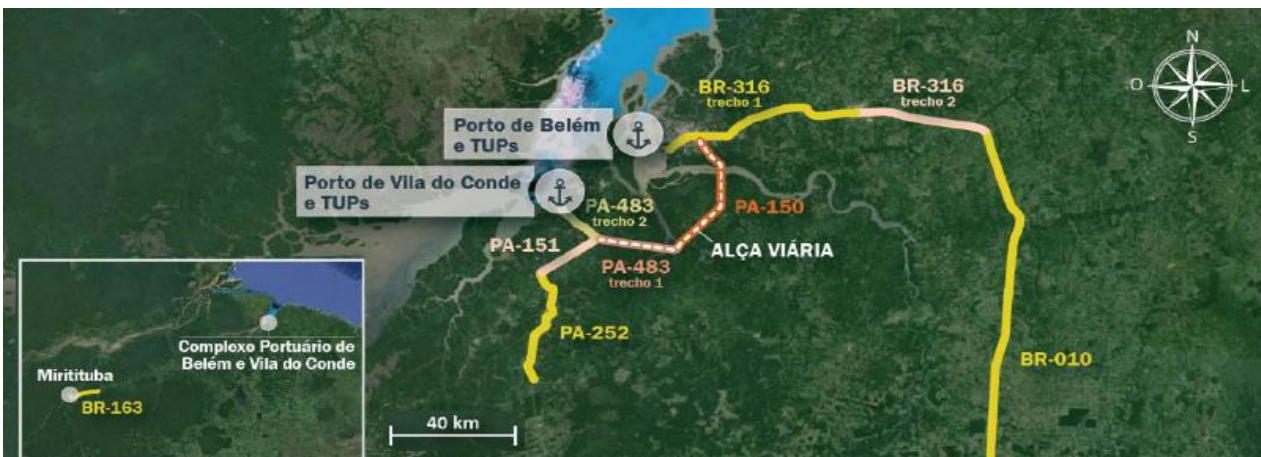
Figura 4: Vias de acesso ao Terminal Petroquímico de Miramar

Além dos acessos aquaviários (hidroviário e marítimo), o Terminal Petroquímico de Miramar é dotado de acesso rodoviário, tendo conexão com sua hinterlândia por meio da BR-316 e BR-010, conectando-se à alça viária pelas rodovias PA-150, PA-483 e PA-151, conforme figura a seguir.