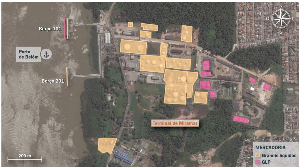
Figura 3: Destinações operacionais dos berços em relação às áreas de armazenagem

Com relação às infraestruturas de armazenagem, o Terminal Petroquímico de Miramar possui instalações de armazenagem de diversas companhias distribuidoras de derivados de petróleo, incluindo combustíveis líquidos e Gás Liquefeito de Petróleo – GLP.