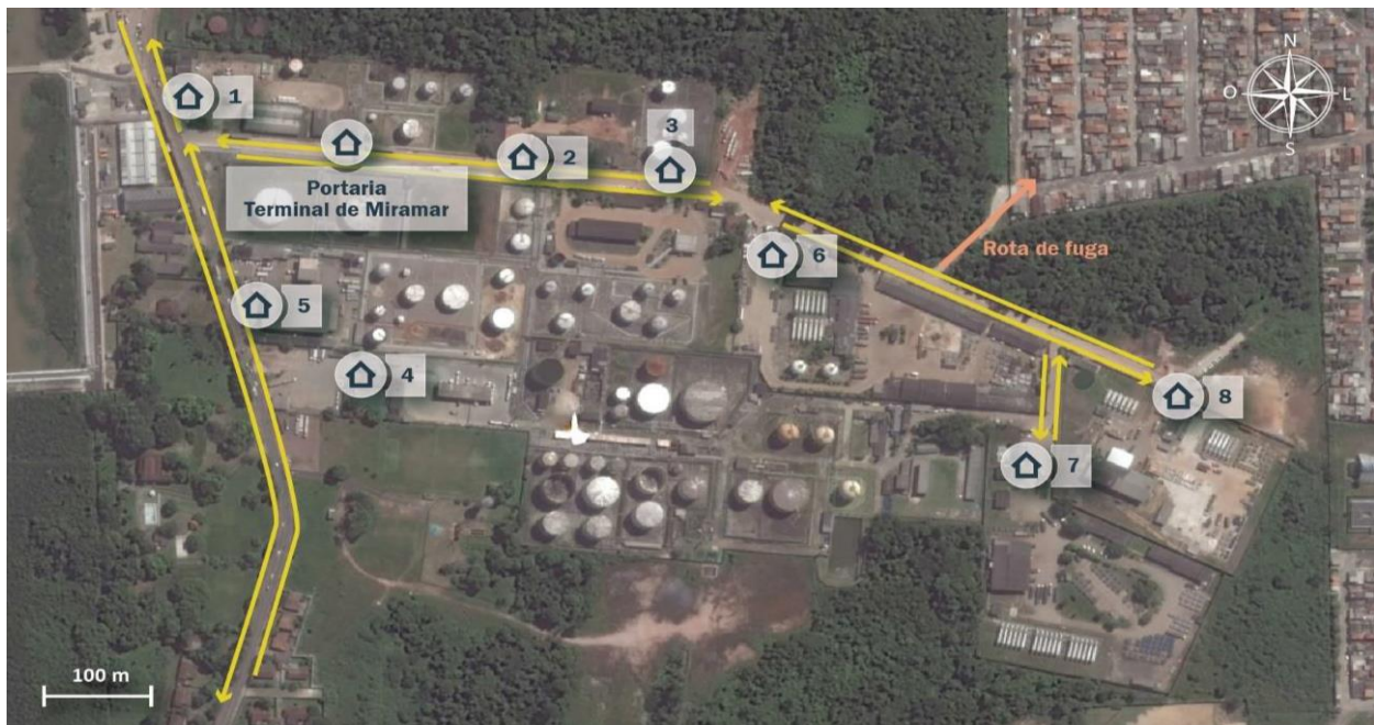
Figura 6: Portarias de acesso ao Terminal Petroquímico de Miramar

O Terminal Petroquímico de Miramar conta com nove (9) portarias de acesso de veículos sendo o principal acesso pela Portaria da Autoridade Portuária, localizada na Rua Salgado Filho, para depois acessarem portarias internas (específicas de cada terminal). A imagem a seguir mostra os acessos ao Terminal de Miramar.