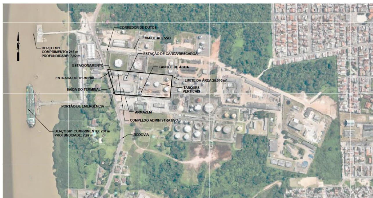
Figura 8: Localização da área do arrendamento BELO4

A superfície da área de arrendamento é de aproximadamente 25.010 m 2 , com conexões aquaviária e rodovia, conforme indicado na figura a seguir.